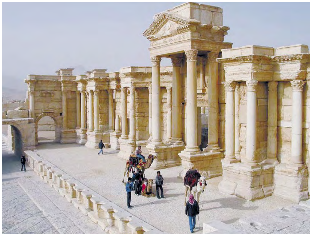
Amfiteatro scena, Palmyra, Sirija © Ieva Butkutė